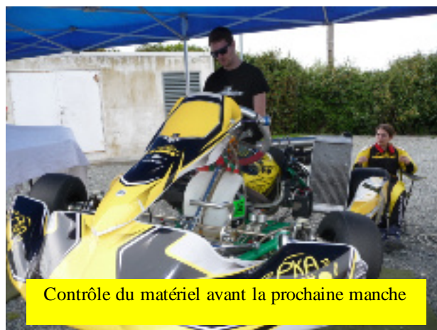
Contrôle du matériel avant la prochaine manche