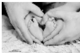
Naissance à St Ouen : 1 Naissances hors commune : 15