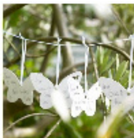
Mariages : 8