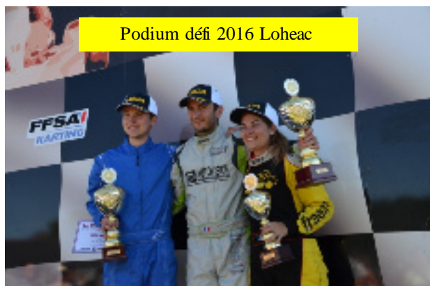
Podium défi 2016 Loheac