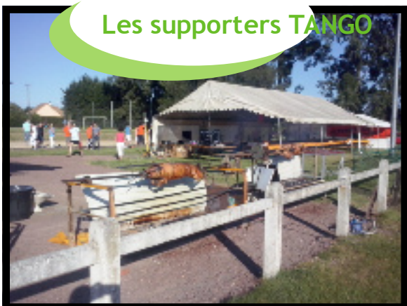
Les supporters TANGO