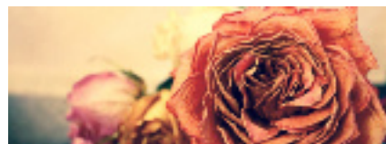
Décès : 7