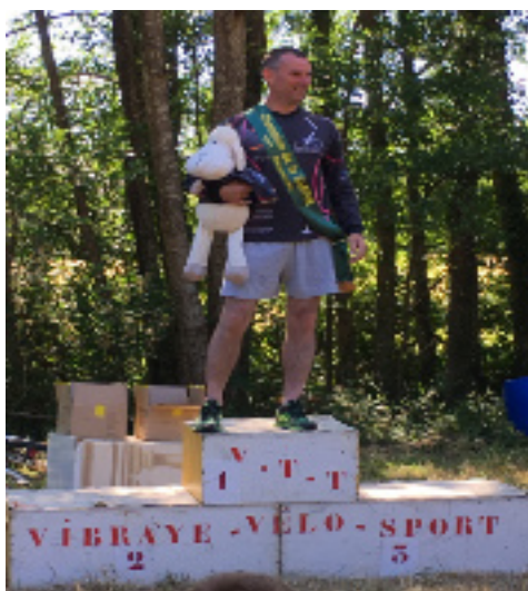
Une belle récompense, le président en personne champion départemental de descente.

L'équipe VCB se joint à moi pour vous souhaiter une bonne et heureuse année 2018.