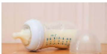
Naissances hors commune : 18