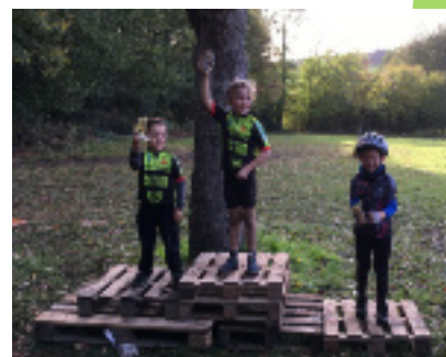
Les jeunes filles ont également leur place