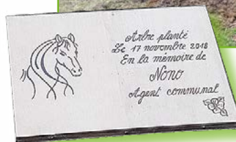
Plaque réalisée par Myriam